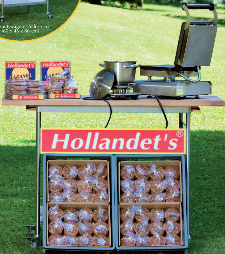
Backwagen / Bake Cart (L x B x H: 126 x 61,5 x 90 cm)