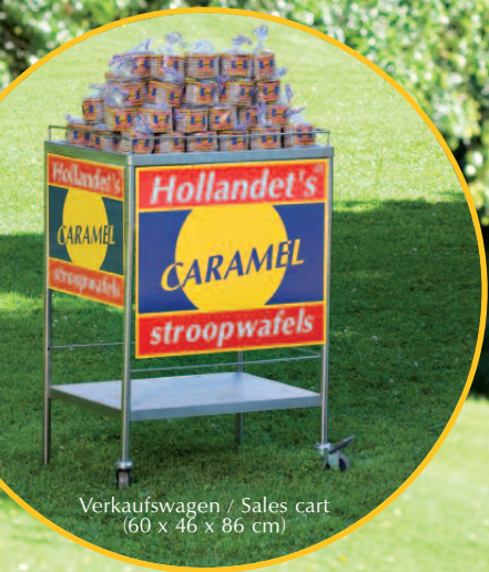
Verkaufswagen / Sales cart (60 x 46 x 86 cm)