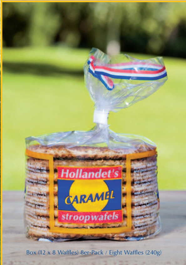
Box (12 x 8 Waffles) 8er-Pack / Eight Waffles (240g)