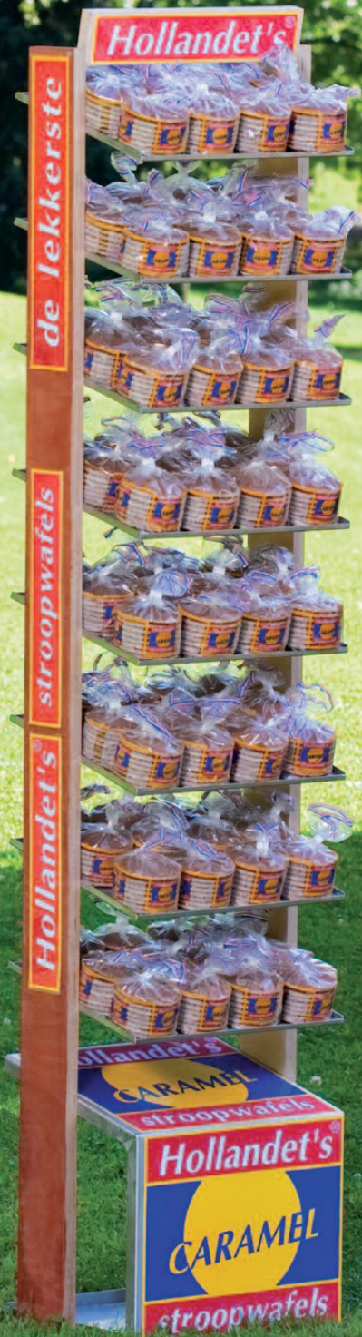
Display (34.5 x 30.5 x 172 cm), Inhalt / contains: 10 Boxes (12 x 8 Wafels)