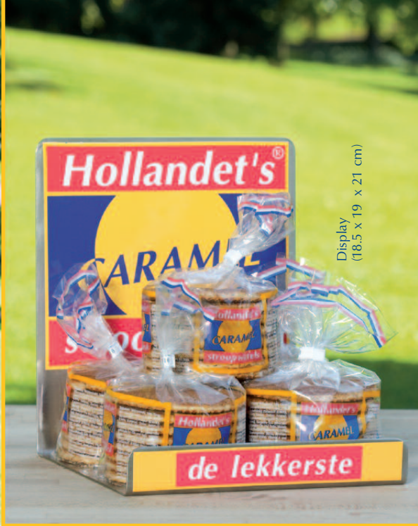
Display (18.5 x 19 x 21 cm)