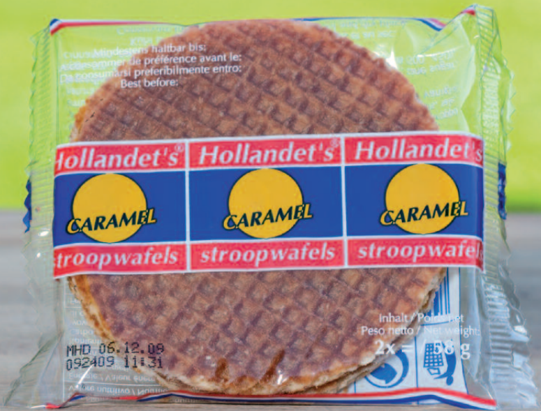
Box (30 x 2 Waffles) 2er-Pack / Two Waffles (58g)