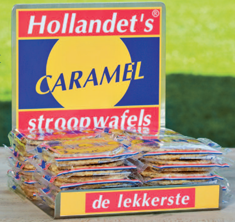
Display (18.5 x 19 x 21 cm)